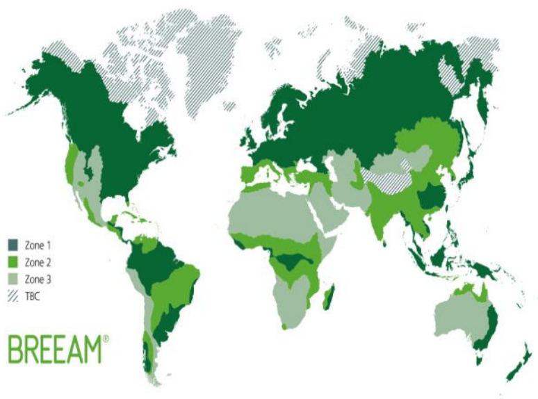
Mapa de España con las zonas de precipitación BREEAM ES