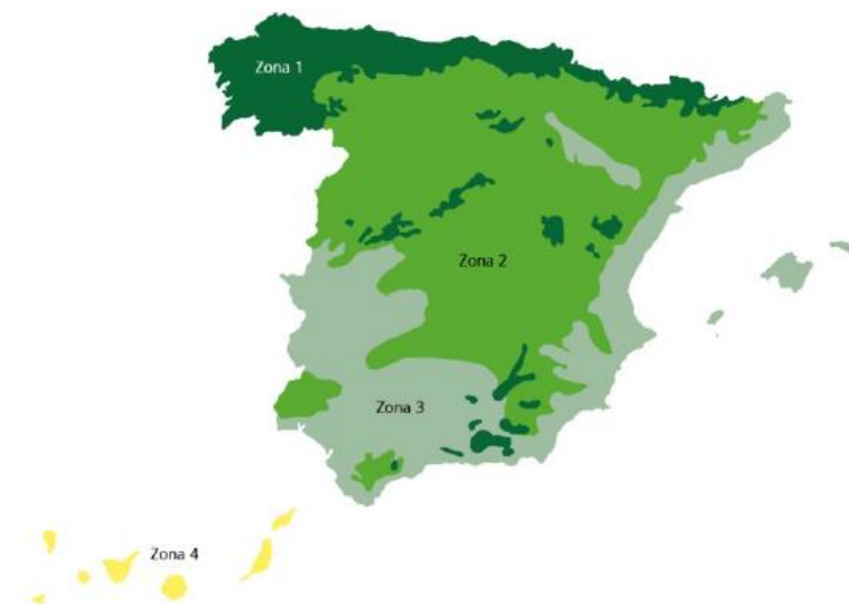
Ilustración 3: Mapa España con las zonas de precipitación BREEAM ES