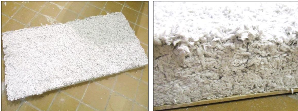
Imágenes 1 y 2 Detalles del proyectado de PERLIWOOL TERMIC