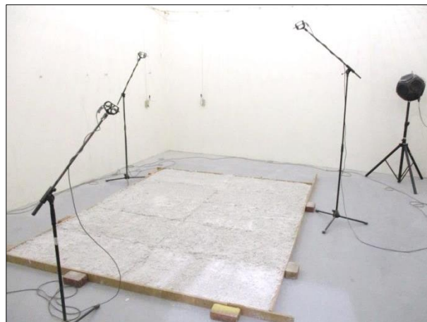
Imagen 3 Muestra lista para el ensayo