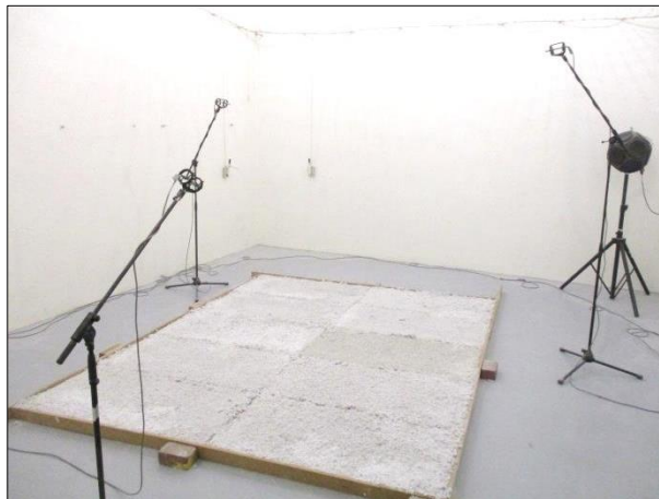
Imagen 3 Muestra lista para el ensayo