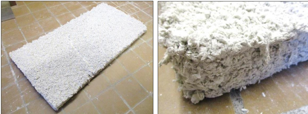
Imágenes 1 y 2 Detalles del proyectado de PERLIWOOL