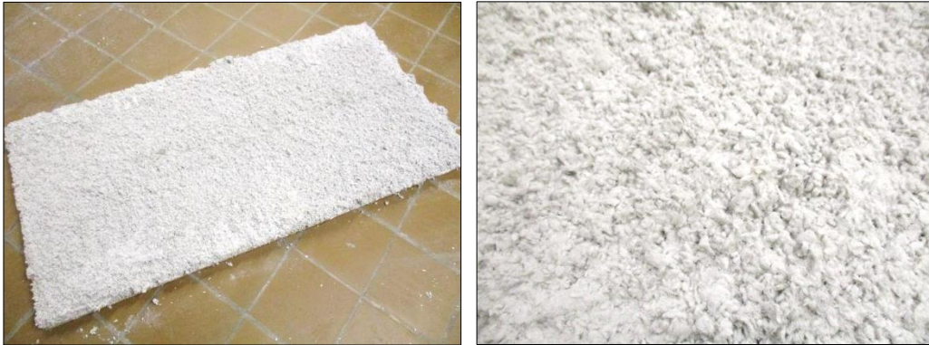
Imágenes 1 y 2 Detalles del proyectado de PERLIWOOL