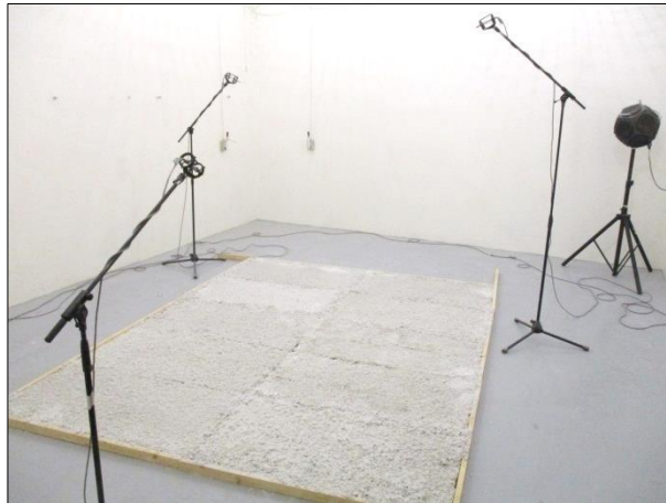
Imagen 3 Muestra lista para el ensayo